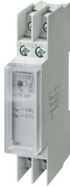
Spannungsrelais T5570 AC 230/400V 1W 0,7/0,9 mit Klarsichtkappe